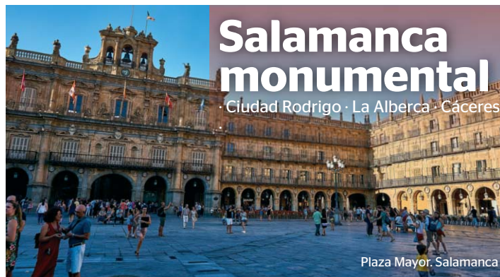
Plaza Mayor. Salamanca