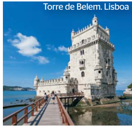
Torre de Belem. Lisboa

Tras el desayuno buffet , salida hacia la cercana ciudad de las siete colinas, Lisboa : con 20 siglos de historia, los viajes marítimos de los descubrimientos ultramarinos la convirtieron en uno de los grandes puertos del mundo. Su luz excepcional, hechizo de escritores, fotógrafos y cineastas, y la policromía de los azulejos de las fachadas le confieren una atmósfera peculiar. Posibilidad de realizar opcionalmente una visita panorámica, recorriendo los más bellos lugares de la capital Lusitana: Plaza Marqués de Pombal, Avenida de la Libertad, Plaza de Rossío, Monasterio de los Jerónimos, Torre de Belem, Monumento a Los Descubridores, etc. Opcionalmente y también con guía local, podremos completar el conocimiento de la capital portuguesa, subiendo al barrio árabe de Alfama, enclavado en la parte alta de la ciudad y presidido por el Castillo de San Jorge. Regreso al hotel. Cena con bebidas incluidas y alojamiento.